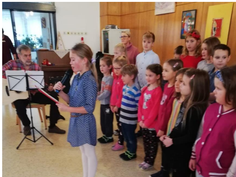
Vánoce ve škole