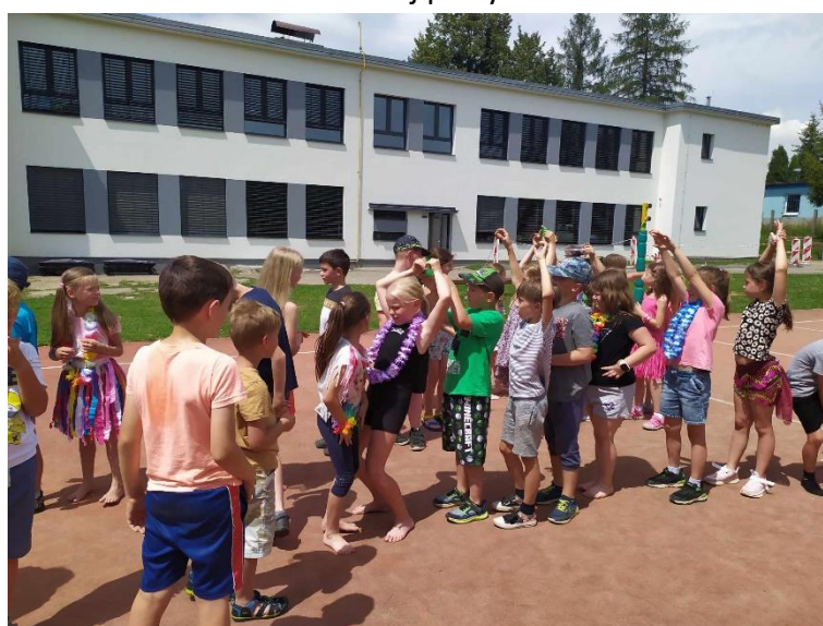
Slavnostní předávání vysvědčení