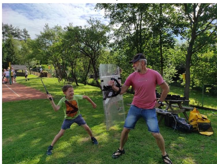
Loučíme se s 2. třídou – Pohádkové lázně