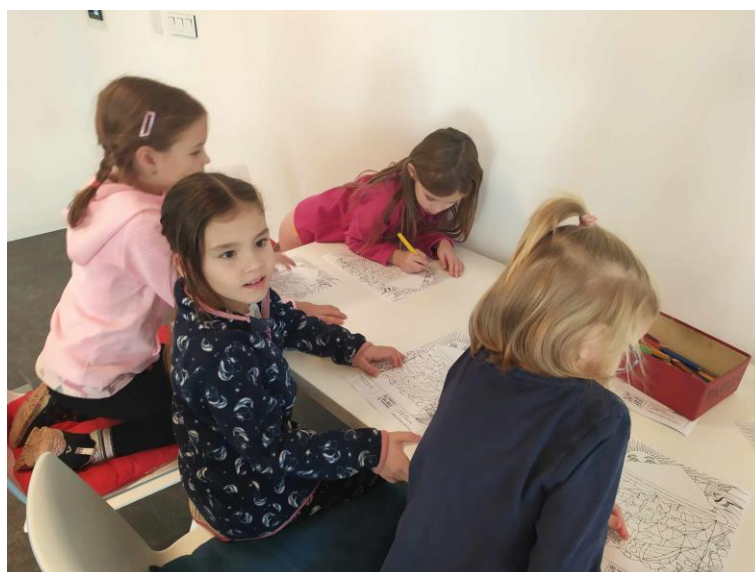
MŠ Tylovice na návštěvě v 1. třídě