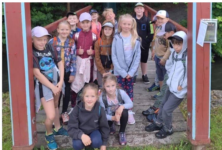
Den s městskou policií a hasiči