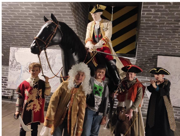
Školní družina na zábavném čtení v městské knihovně