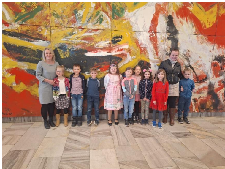
Velikonoční den ve druhé třídě