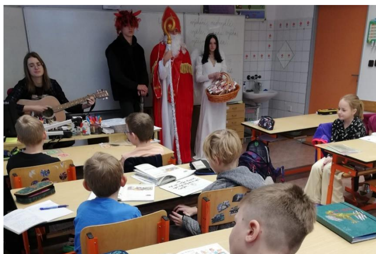
Charitativní projekt „Vánoční hvězda“