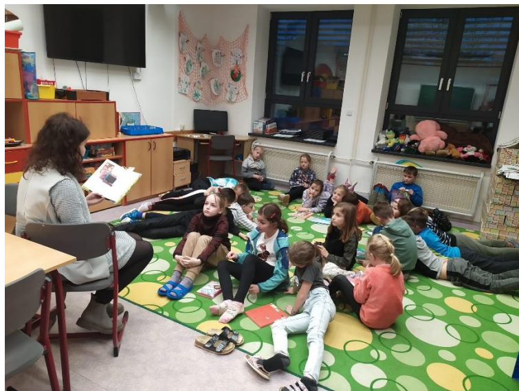
Zápis do prvního ročníku