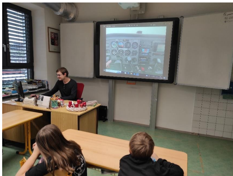
Vánoční besídka 1. a 3. ročníku