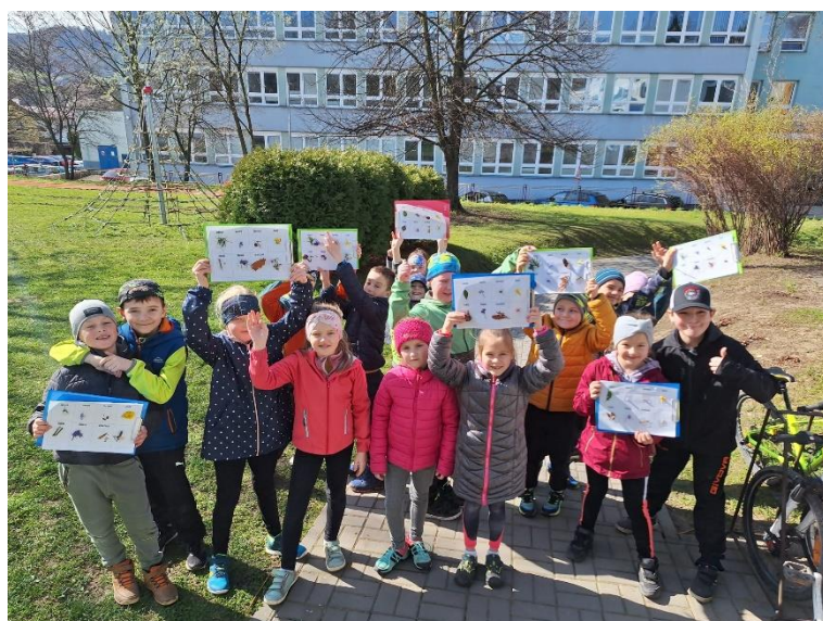
Velikonoční tvoření v 1. třídě