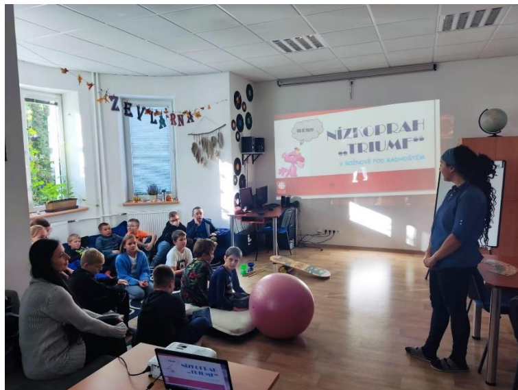
Školní družina na besedě v městské knihovně