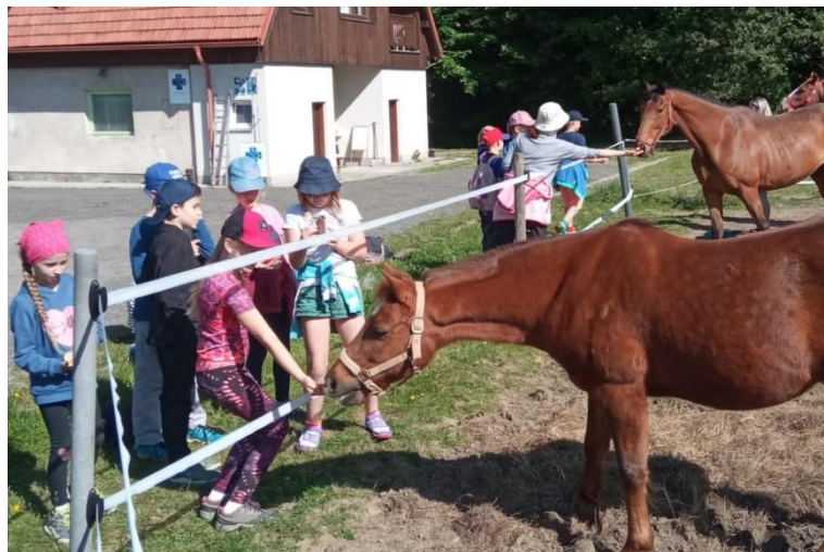
Exkurze páťáků do Trezoru přírody