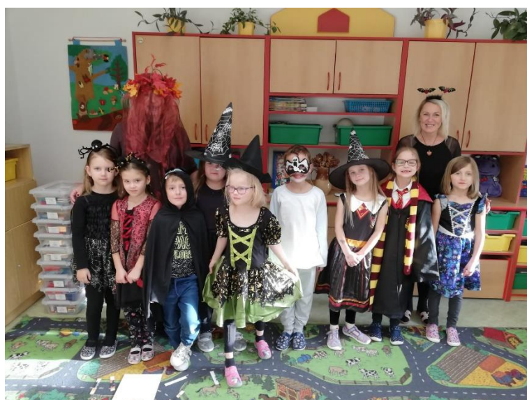
Literární dílna v městské knihovně