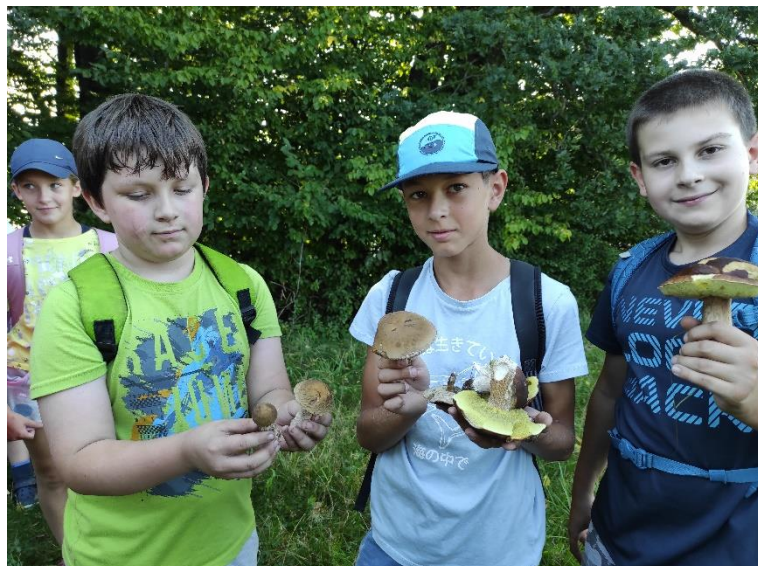
2. ročník na Dni ptákovin