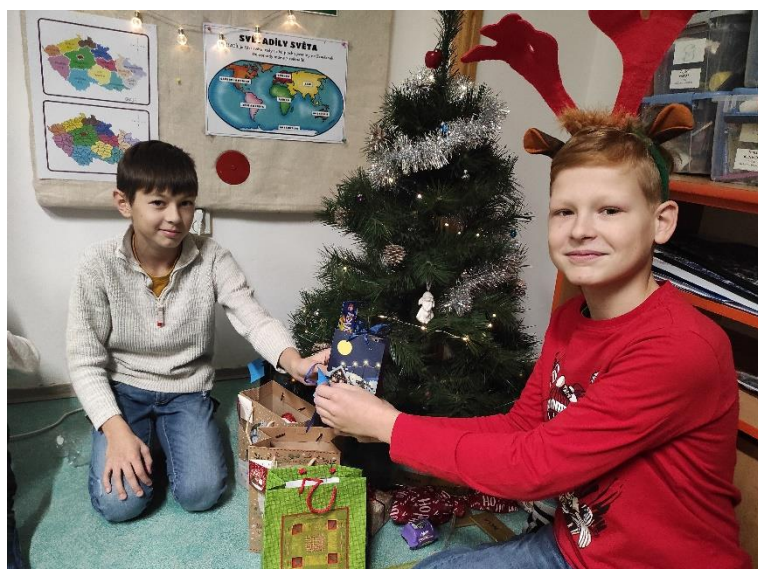
Vánoce ve školní družině