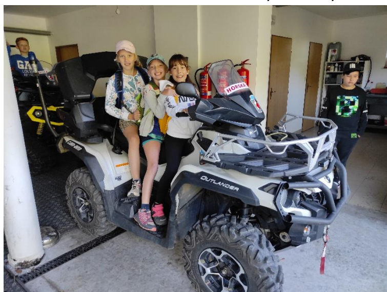
Vycházka školní družiny na Jurkovičovu rozhlednu