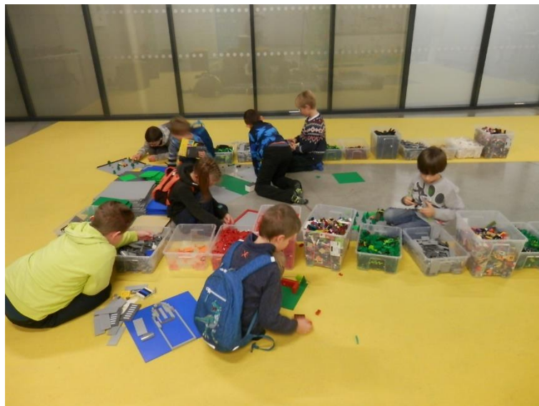
Oslava vysvědčení ve školní družině