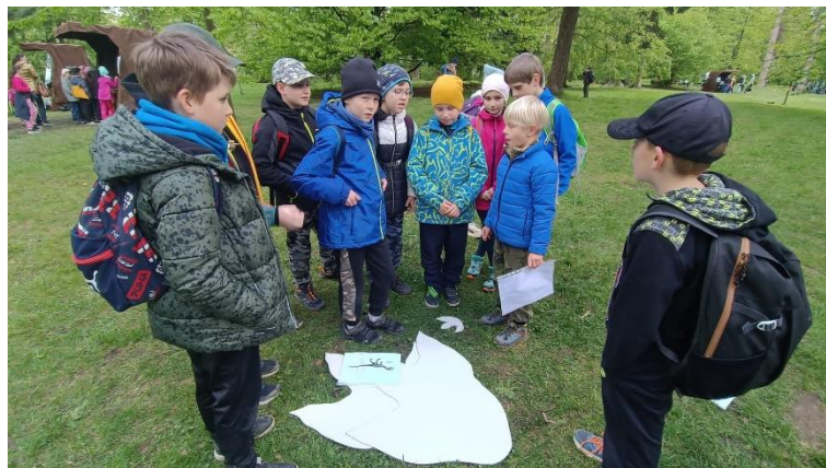
Exkurze do Laudonova domu v Novém Jičíně