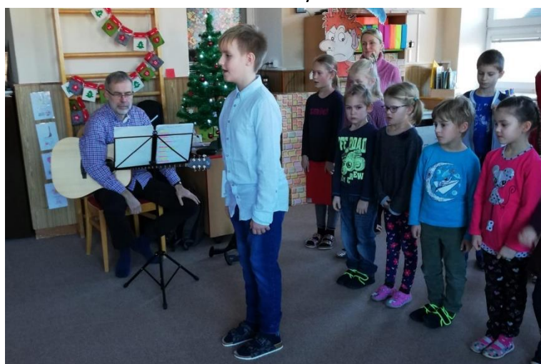
Vánoční besídka 1. a 3. třídy v MŠ Tylovice