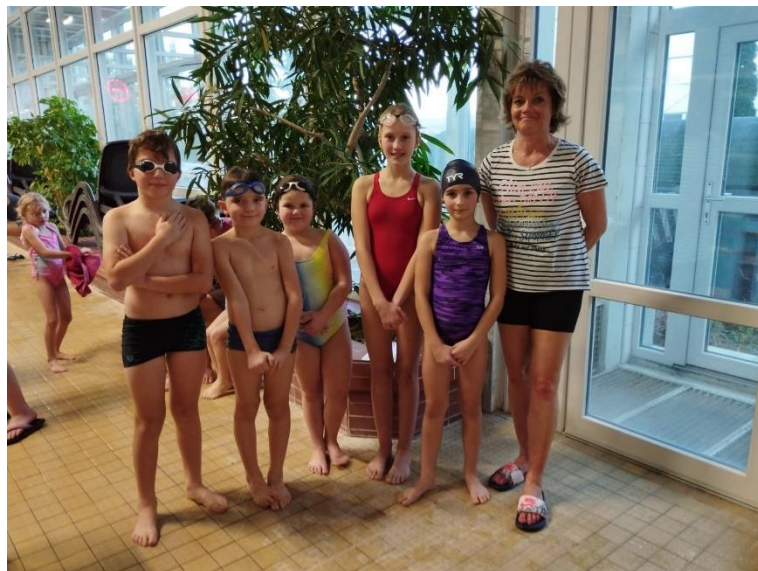
Vánoční besídka 1. a 3. třídy v MŠ Na Zahradách