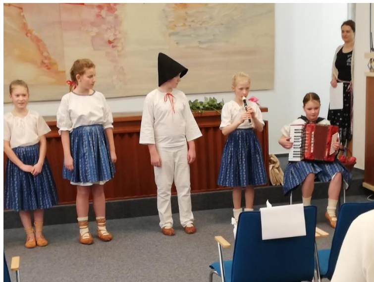
Vystoupení dětí 1. a 3. ročníku v domově seniorů – vítání jara