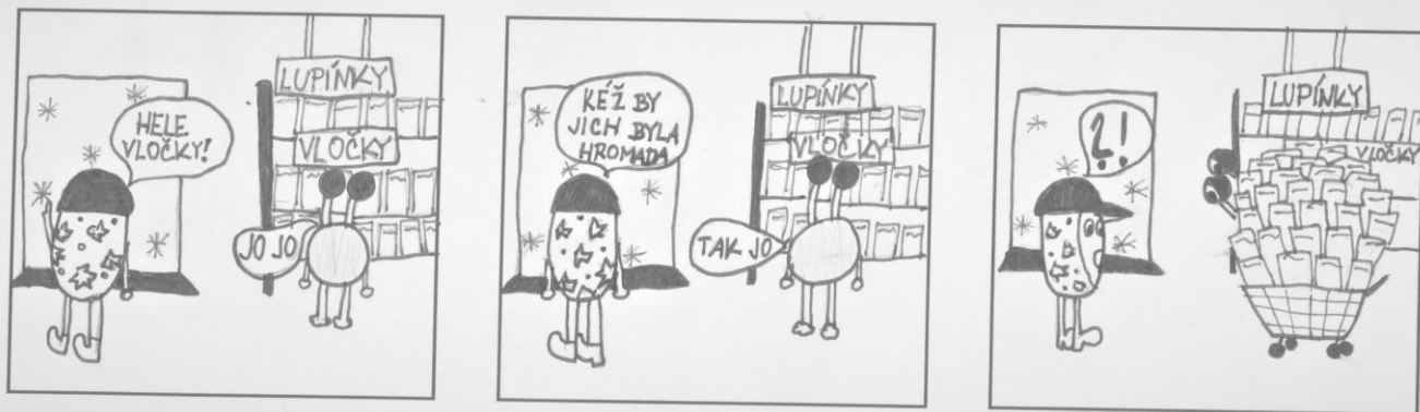
Kukadlo a Elektrizáček v obchodě