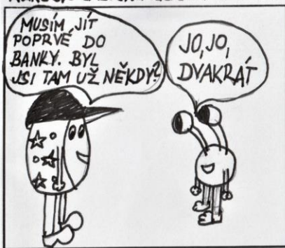
Kukadlo a Elektrizáček v bance